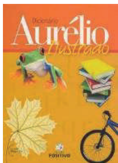
Aurélio Ilustrado Dicionário Escolar/L. Portuguesa Editora: Positivo