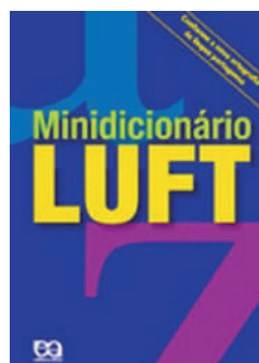
Minidicionário LUFT Editora: Ática