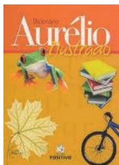
Aurélio Ilustrado Dicionário Escolar/L. Portuguesa Editora: Positivo