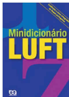
Minidicionário LUFT Editora: Ática